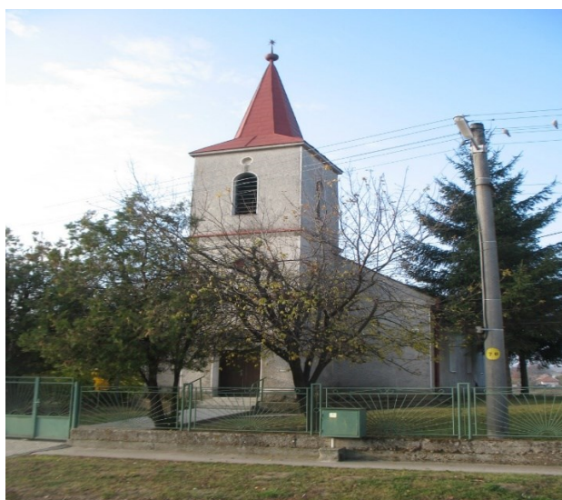
Kostol reformovanej kresťanskej cirkvi