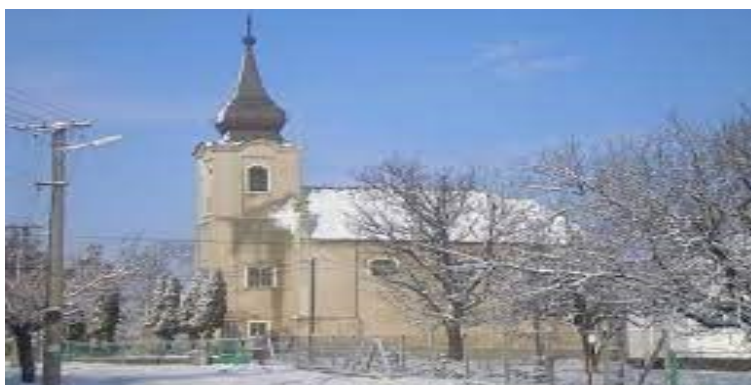
Kostol rímskokatolíckej cirkvi

Medzi pamätné stavby obce Beša patrí rímskokatolícky kostol Sv. Anny z roku 1770, ktorý bol vyhlásený za národnú kultúrnu pamiatku. Medzi mladšie pamätihodnosti môžeme zaradiť kostol reformovanej kresťanskej cirkvi , ktorý bol vybudovaný v roku 1963 a drevenú zvonicu v centre obce.