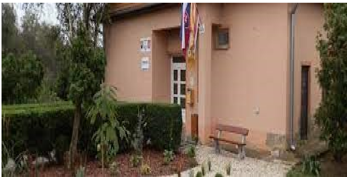
Budova Obecného úradu