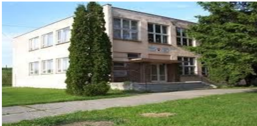
Budova materskej školy

V súčasnosti výchovu a vzdelávanie detí v obci poskytuje Materská škola Beša.